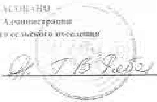
ГРАФИК ВЫВОЗА ТКО НА 2025 ГОД

Генерална администрация Администрация общински «Саргус»