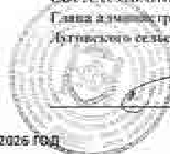
ГРАФИК ВЫВОЗА ТКОА 2026 ГОД