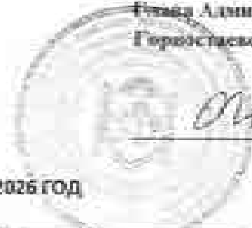
ГРАФИК ВЫВОЗА ТКО НА 2026 ГОД